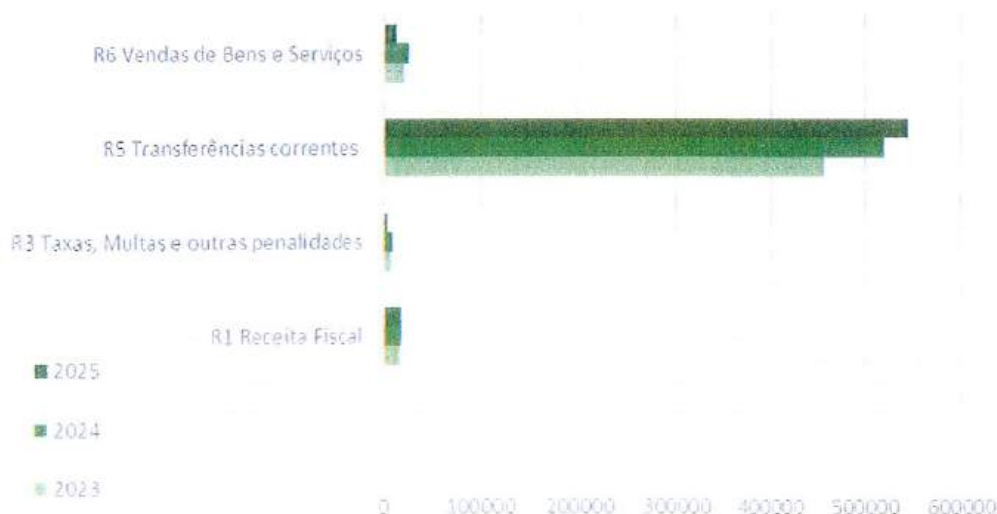
EVOLUÇÃO DAS RECEITAS CORRENTES (2023-2025)