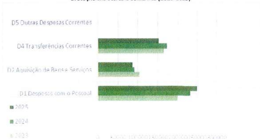
EVOLUÇÃO DAS DESPESAS CORRENTES (2023-2025)

Em síntese, comparativamente ao ano de 2024, o total das despesas correntes, em 2025, diminuiu em 1,63%.